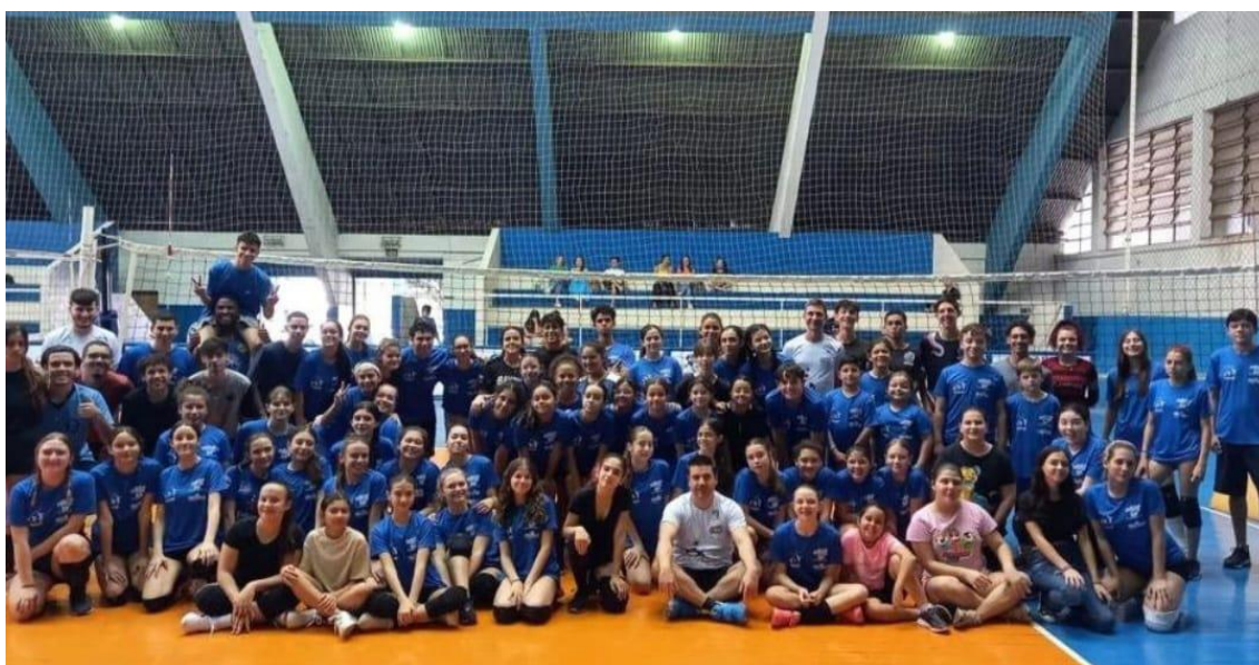
Evento Cartinhas de Natal