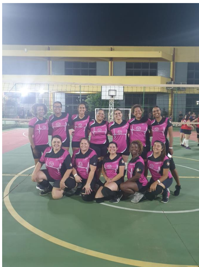
Livre Feminino (Aperfeiçoam.)