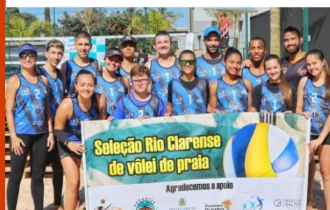
Vôlei de Praia